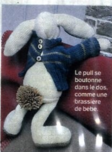
Le pull se boutonne dans le dos, comme une brassière de bébé.

par les épaules. Fermer les côtés en laissant une ouverture de 4 cm en haut. Coudre l'assise en laissant une ouverture de 4 cm à 1 cm de chaque côté du devant. Fixer les bras et les jambes dans les fentes laissées ouvertes. Rembourrer le corps. Réunir les 2 côtés de la tête en laissant le bas ouvert. Coudre les oreilles dans les fentes. Rembourrer la tête et la coudre sur le corps. Avec le fil lin, faire 2 grands points lancés pour la bouche. Au-dessus, broder le nez par quelques points lancés. Terminer en faisant un point de croix pour chaque œil. Faire un pompon avec le fil lin et le coudre en guise de queue.