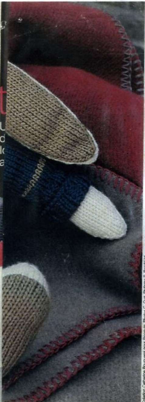
Création Catherine Bouquetier pour Pingouin.

par les épaules. Fermer les côtés en laissant une ouverture de 4 cm en haut. Coudre l'assise en laissant une ouverture de 4 cm à 1 cm de chaque côté du devant. Fixer les bras et les jambes dans les fentes laissées ouvertes. Rembourrer le corps. Réunir les 2 côtés de la tête en laissant le bas ouvert. Coudre les oreilles dans les fentes. Rembourrer la tête et la coudre sur le corps. Avec le fil lin, faire 2 grands points lancés pour la bouche. Au-dessus, broder le nez par quelques points lancés. Terminer en faisant un point de croix pour chaque œil. Faire un pompon avec le fil lin et le coudre en guise de queue.