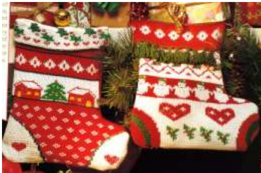
les chaussettes de Noël